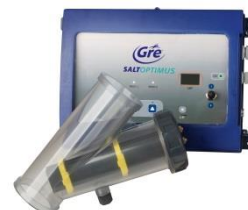
Electrólisis salina Salt chlorinator ESP60