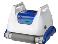
Robot Robot RKA80C