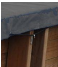
Cubierta de invierno Winter cover CI790207