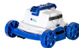
Robot Robot RKJ14