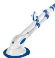
Limpiafondos automático Automatic cleaner 90399